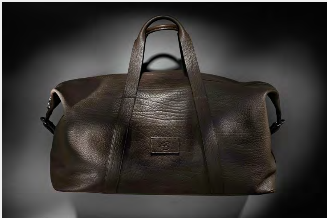
Hold All 55 und 65 L

These extra spacious and beautiful travel companions are made of the highest quality bison leather. Two carrying handles and a detachable shoulder strap as well as the outside pocket complete the design. Inside, the model is equipped with high quality linen lining. This bag can be made to your individual measurements