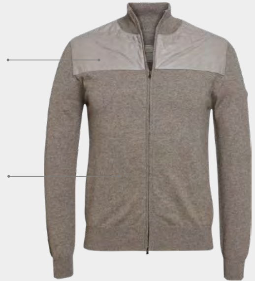
Feinstes Kaschmir Finest cashmere