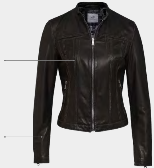
Verstellbare Ärmelweite Adjustable sleeve width

Kurz, sportiv, feminin – so präsentiert sich das Modell Salt Lake. Ein Stehkragen und doppelte Teilungsnähte sorgen für eine sportive und körperbetonte Silhouette. Von außen präsentiert sie sich aus Softkalb oder Lammnappa soft, innen ist sie mit einem 60er Jahre F1 Heritage Print gefüttert. Raffiniert eingearbeitete Brusttaschen und Reißverschlüsse an den Ärmeln geben dieser Lederjacke den besonderen Kick.