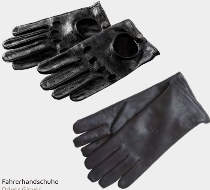
Fahrerhandschuhe Driver Gloves

Für eine stillichere Fahrt im Cabrio sind unsere Fahrerhandschuhe unverzichtbare Essentials mit nostalgischer Note. Sportive Handnähte, der klassische Oberhandausschnitt und ein Druckknopf mit Logo-Prägung verleihen den Handschuhen ihren einzigartigen Charakter. Die Hand- innenseite ist zusätzlich speziell verarbeitet, für einen extra guten Grip.