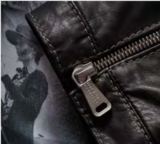
Modellierte Steppnähte Stylish dynamic seams