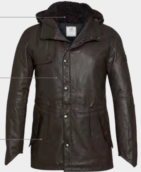
Bequeme Pattentasche Comfortable flap pockets

Das Modell Sherman ist der Prototyp eines Parkas mit Kapuze und Kordelzug. Die aufwändig gearbeiteten Ärmelabschlüsse mit einklappbarem Handschutz sowie die markanten Pattentaschen mit Doppelverschluss zählen zu den funktionellen Details. Perfekt abgerundet wird das Design der Sherman Jacke durch ein weiches Kalbnapfleder.