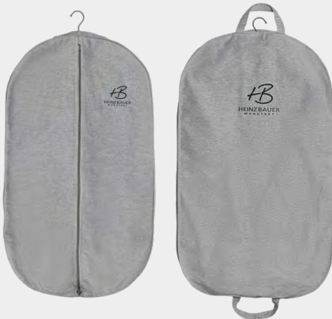
Kleidersack Garment bag

Hochwertiger Kleidersack, der Ihre Heinz Bauer Manufaktur Jacke schützt. Exclusive garment bag that protects your Heinz Bauer Manufaktur Jacket.