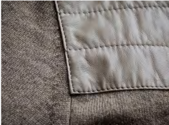
Feines Leder durchgesteppt Quilted leather