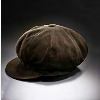
Basecap warm Basecap warm

This cap is the perfect companion for you, with or without ear warmer flaps, to match you jacket.