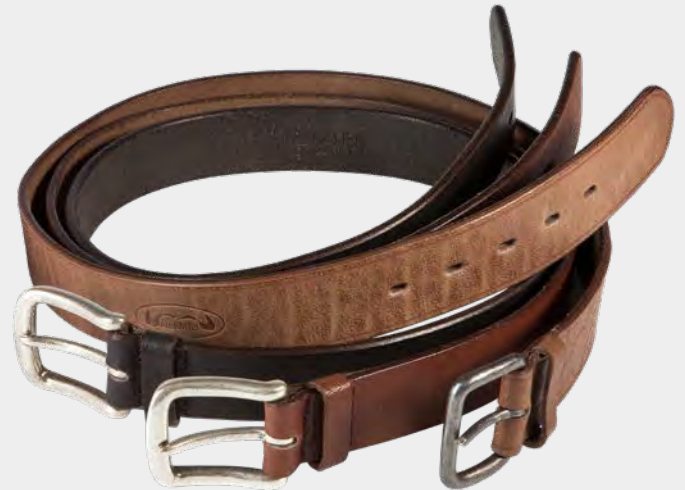
Gürtel Albbüffel Belt alb buffalo

A remarkable piece! The belt in vintage look has a clasp which is six to eight millimeters thick. The strong Alb buffalo leather stays in shape, has a pleasant grip and a nice grain structure which is very characteristic for this leather. This authentic leather is exclusively processed for Heinz Bauer Manufakt. It derives from the local biosphere Albregion and is tanned by using bark, chestnut and mimosa. A skin can not be more honestly (naturally) processed!